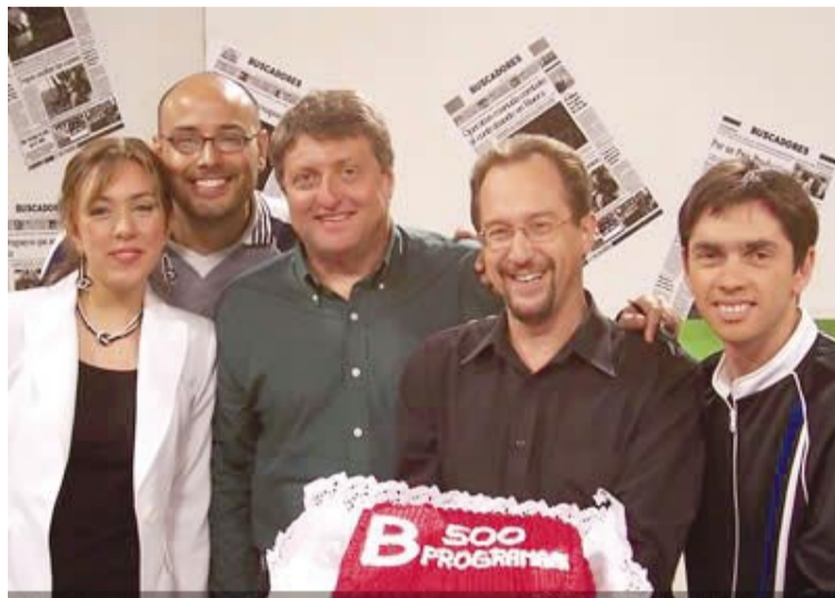
Con el equipo de "Buscadores"

Un día estoy en la puerta del canal en Argentina hablando por celular, un año después del tema del correo electrónico y él se me acercó. Ni me dejó